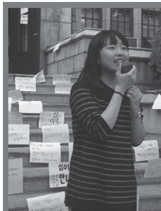
이화여대 등록금 인상 반대 투쟁