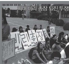
외대 비리 총장 퇴진 투쟁