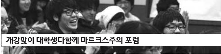
개강맞이 대학생다함께 마르크스주의 포럼