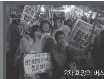
2차 희망의 버스